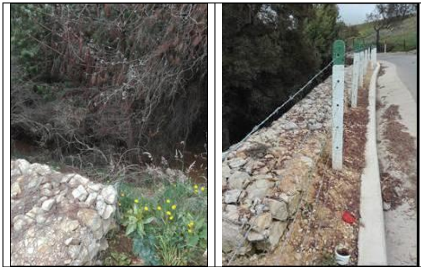
Foto 3 y 4. Muros de contención.

En cuanto a la verificación de las contenciones (Gaviones), se observa que al inicio del tramo de la segunda contención, presentan separaciones exageradas del material de lleno (cantos), con dimensiones desequilibradas que pueden afectar su funcionalidad y estabilidad.