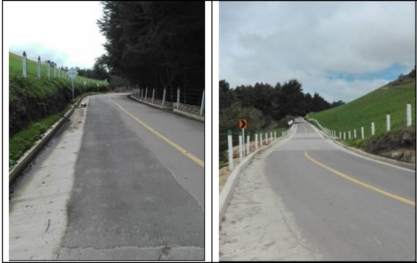
Foto 1 y 2. Carpeta asfáltica con deficiente acabado.

900 metros del inicio del segmento se presenta una reparación de la carpeta asfáltica cuya área aproximada es 48.3 metros cuadrados, con deficiencias en su acabado, razón por la cual se establece una posible falla en las condiciones de calidad de la obra tal y como se observa en las siguientes imágenes: